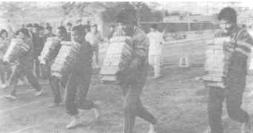
“叭”——随着一声发令枪响，5名健儿各搬起20块砖疾步如飞，仅1分多钟，就抵达60米终点。这是摄自市首届农运会中的一个竞赛场面。

《东营年鉴》编纂两报发行暨政府系统办公自动化工作会议召开 本报讯 10月29日，全市《东营年鉴》编纂、《经济日报》、《山东政报》发行暨政府系统办公自动化工作会议召开。会议分别就《东营年鉴》的编纂、两报的征订发行及政府系统办公自动化工作做了具体部署。（教连）