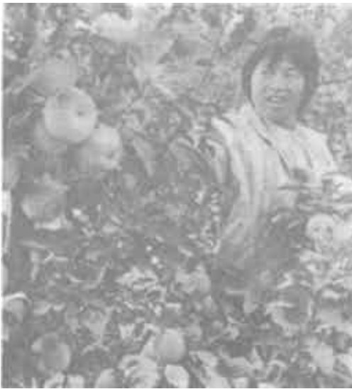
本版责任编辑 黄功霖

金秋，利津县虎滩乡又传丰收喜讯：全乡进入盛果期的2500亩苹果每亩平均产量达1500公斤。图为果农们正在采收苹果。